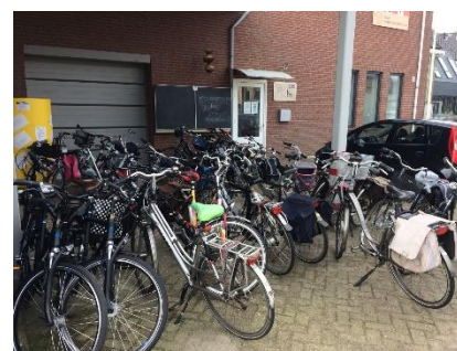
zo wordt het weer!

We blijven op elkaar betrokken, zijn solidair en zorgen natuurlijk voor elkaar!